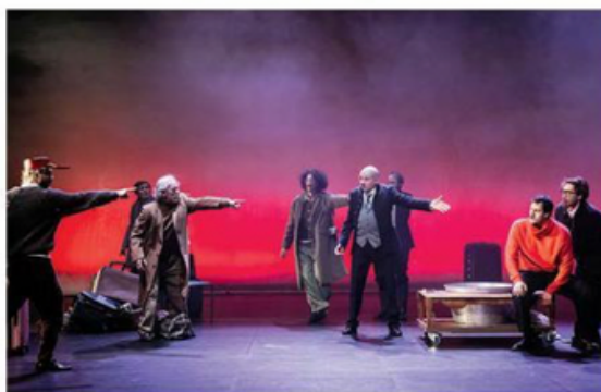
Le Mandat démonte les mécanismes des dictatures avec effronterie et truculence.