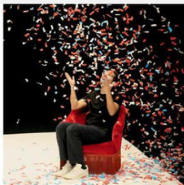
Seul-en-scène pour un dialogue interculturel.